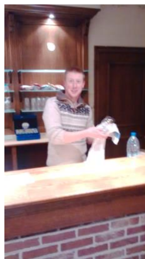
Onze nieuwe aanwinst