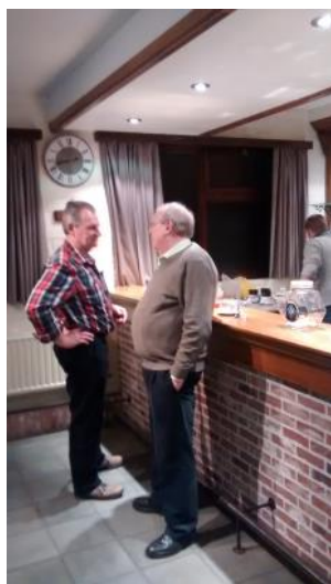
Ere - en andere voorzitter