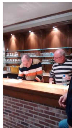
Verkeerde kant v/d toog