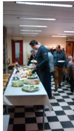
Pas lid en al eten!